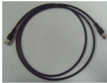
信号输入 DB 线