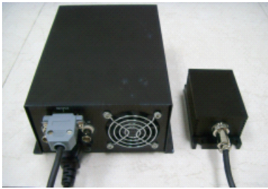
激光器（后面板）整体连接示意图

3.1 安装方法： 对照左侧激光器整体组装示意图所示，参照 3.3 示意图说明表，先将激光头连接线连接到激光头输出端，并拧紧螺钉；再将另一端紧密的插入电源后面板的 15 针供电输出口，并用一字螺丝刀拧紧两端的螺钉。再将外接 AC 电源线正确的插入电源后面板的三芯电源插座内。将相同序列号的电源与激光头正确连接，在连接的过程中要注意电源与激光头是否匹配，若不匹配请勿连接，以免造成激光器损坏，使之不能正常工作。