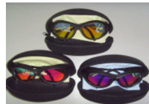
镭志威激光防护眼镜

注: 北京镭志威光电技术有限公司在销售激光器的时候, 考虑到我们客户的安全使用问题, 同时还可提供相应的激光防护眼镜。(如右图)